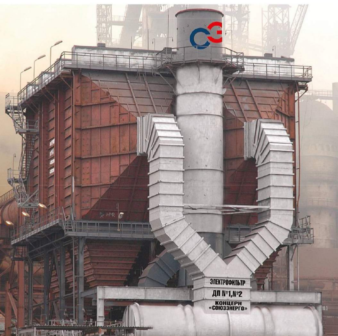
Электрофильтр для очистки аспирационных выбросов литейных дворов доменных печей.

Проектные работы в Концерне выполняет департамент инжиниринга, целью которого является разработка конкурентного оборудования.